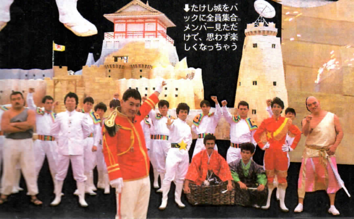
↓たけし城をバックに全員集合。メンバー見たただけで、思わず楽しくなっちゃう